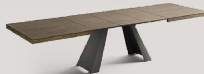
Tavolo allungabile Extendable table / Ausziehbarer Tisch ⇄ cm 180 ↗ cm 100 ↓ cm 75 (315 cm aperto / open 315 cm / 315 cm offen)