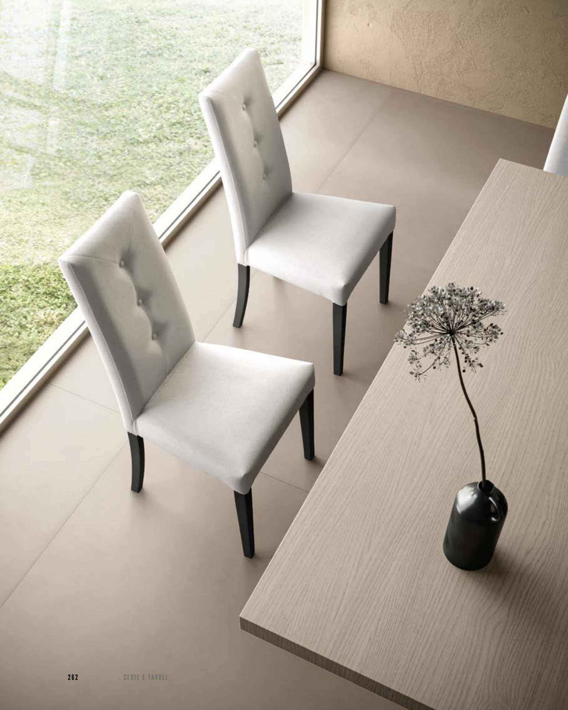
SEDIA CON SEDUTA IN ECOPELLE chairs with faux leather seat / stuhl mit kunstledersitz