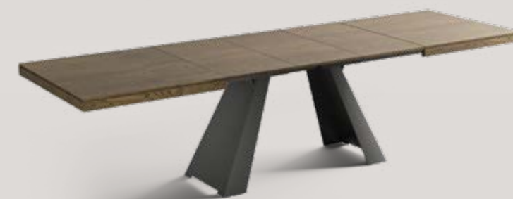
Tavolo allungabile Extendable table / Ausziehbarer Tisch ⇄ cm 160 ↗ cm 90 ↓ cm 75 (295 cm aperto / open 295 cm / 295 cm offen)