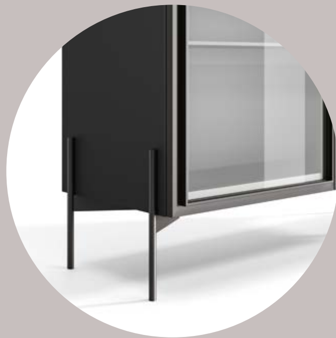
1 Basamento Ventura Ventura base / Sockel Ventura

Wählen Sie den Sockel für Ihre Kommode / Kunst und Technik sind unerlässlich, um innovative Lösungen mit maximaler Funktionalität zu erreichen. Die schönen und haltbaren Füße, die in vielen Variationen erhältlich sind, sind ideal, um die Kommode aufzuwerten. Kostbare Details für jeden Geschmack.