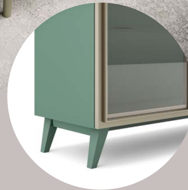
3 Basamento piede legno Wood foot base / Sockel Fuß aus Holz