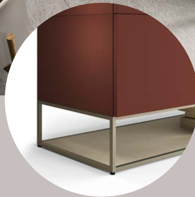
2 Basamento alluminio Plint hs aluminium / Sockel aluminium