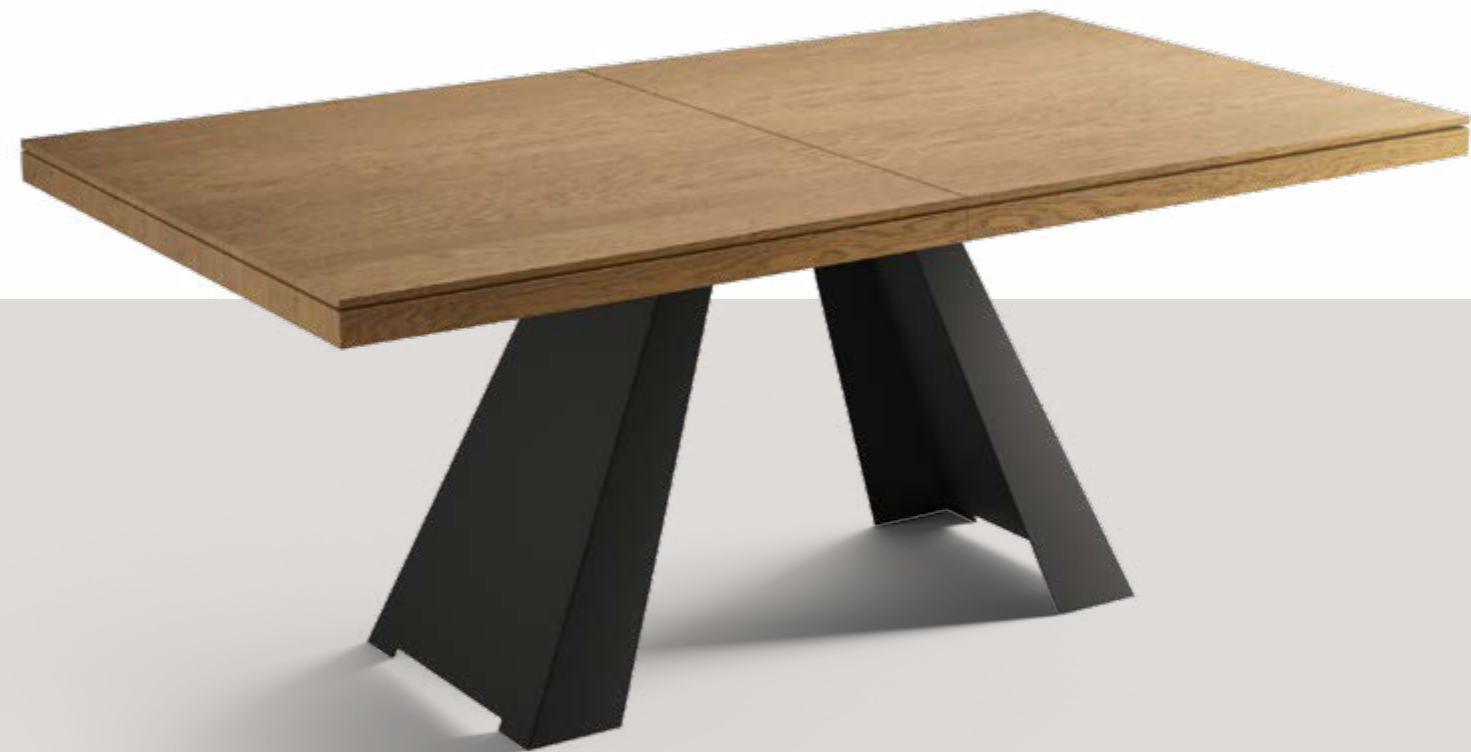
TAVOLO IMPIALLACCIATO ALLUNGABILE extendable veneered table / ausziehbarer furniertisch